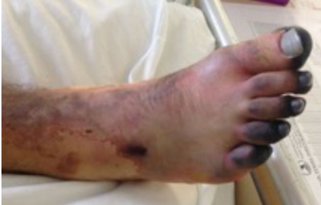
Resim 8. Nekroza giden distal ekstremiteler 2