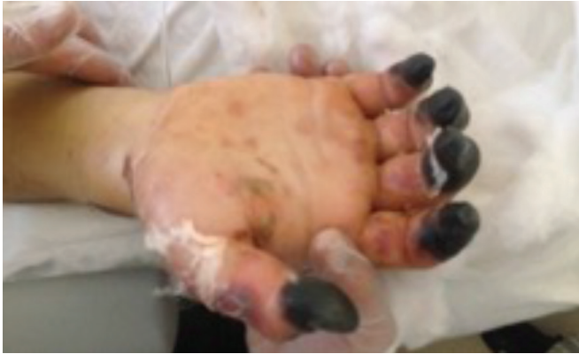
Resim 9. Nekroza giden distal ekstremiteler 3