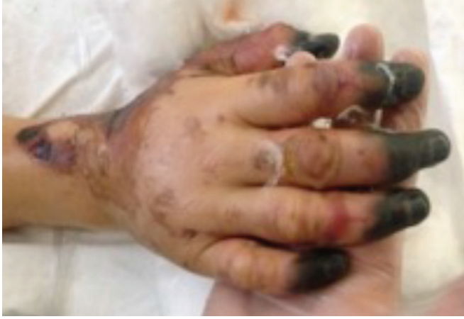
Resim 7. Nekroza giden distal ekstremiteler 1

Olgumuzdaki gibi başvuru anında hastalarda düşük kan basıncına eşlik eden taşikardi izlenebilir. Erken vasküler instabiliteye bağlı postural hipotansiyon da sık karşılaşılan bulgulardır. Peteşiler birleşerek purpurik ve ekimotik lezyonlara dönüşebilirler. Hastamızda tedavinin 2. gününde başlayıp ilerleyen ve amputasyonun düşünüldüğü ekstremitte nekrozları izlendi (Resim 7-9). Bu şekilde vasküler komplikasyonlar ilişkili ekstremitte kayıpları ile, yaşayan bireylerde sekeller kalabilir (11). Ekstremitte nekrozlarının en yoğun izlendiği sağ el distal falankslara etkisi açısından hastaya stellat ganglion blokajı yapıldı, işlem birkaç seans devam edildi. Nekroz alanlarında dolaşımın arttığı gözlemlendi. Stellat ganglion bloğu sırasında kardiyak arreste varabilen çok ciddi komplikasyonlar görülebileceği unutulmamalı blokaj öncesi hasta iyi değerlendirilmeli ve monitörize edilmelidir. Fulminan meningokoksemi meningokokların dolaşımında hızla çoğalması ve endotoksin düzeylerinin hızla artması ile karakterizedir. Hastamızda da olduğu gibi ağır ve 24 saatten uzun süren şok tablosu izlenir. Bu nedenle en kısa sürede ilk doz antibiyoterapinin uygulanması hayati