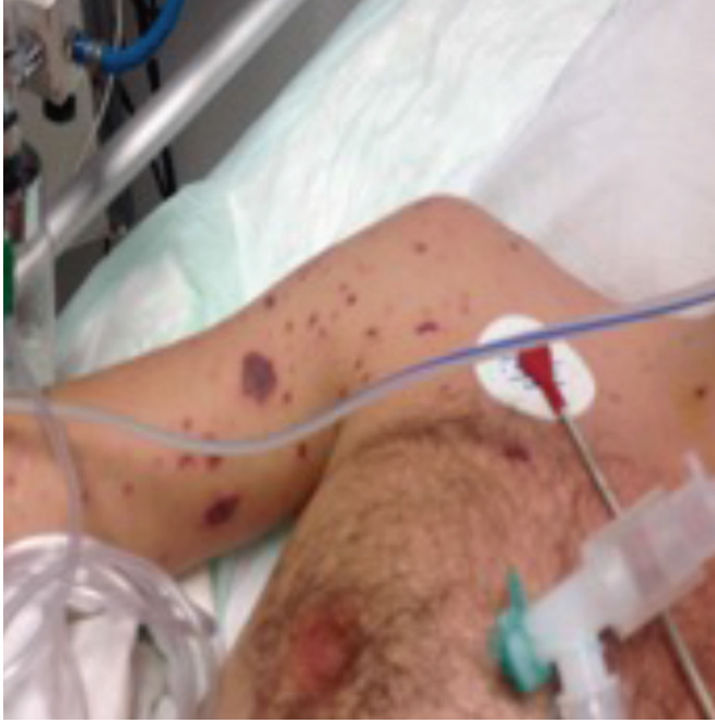
Resim 1. Purpurik-ekimotik lezyonlar 1