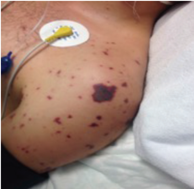
Resim 2. Purpurik-ekimotik lezyonlar 2