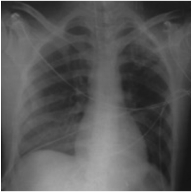
Resim 4. Başvuru akciğer grafisi