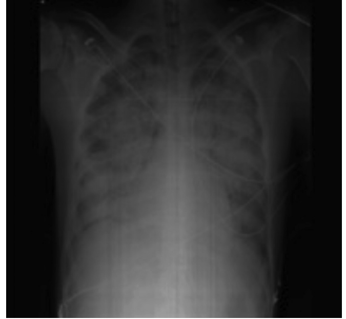
Resim 5. On altıncı saatteki akciğer grafisi

N. meningitidis gram negatif aerobik diplokoktur. On üç serogruba ayrılırlar ayrıca yirmi farklı da serotipi bulunmaktadır.