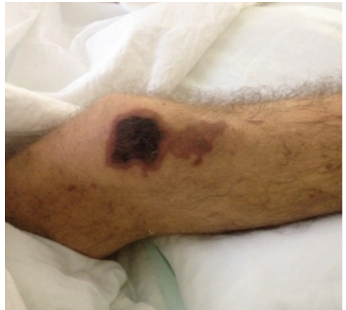
Resim 3. Purpurik-ekimotik lezyonlar 3